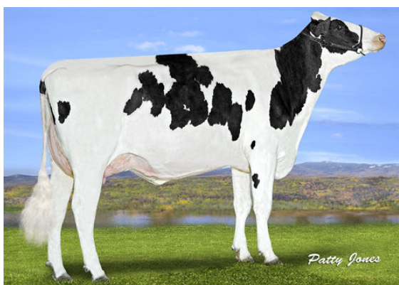
PROGENESIS MONTANA BEAUVAIS GRANDDAM